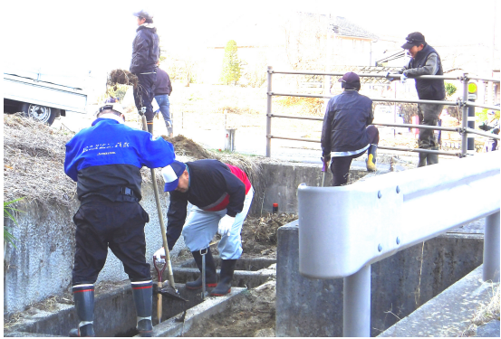
土砂を樹から掘り出す作業はかなりハード

3月22日(日)、中坪区の一大事業である一斉作業が行われました。 各常会から選出された精鋭部隊に消防団の皆さんを加え、総勢約60名が中坪区内に散らばり、まさに一斉作業でした。昨年までは一区民として参加しており、