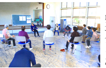
中坪公民館で行っている「いいなここから元気塾」

設置に手をつけてみたいと計画しております。特にベンチの作製は、どのような形にするか、どのように作るか悩んでいる最中です。メンバーの意見と知恵を出し合い、進めていきたいと考えています。現在の山の状況を報告させていただきますと、下刈り作業時に残してきた「タラの芽」が採れるようになり、取り頃を迎えているようです。山の恵みに感謝しつつ、当会の活動を頑張らなければならぬと思っております。(中坪千本桜の会 SM)