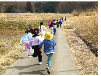
元気に蟻塚城址向かう園児たち

フレイルとは、加齢によって心身が衰えた状態を言い、次の4種類に分けられます。①身体フレイル ・筋力やバランスの低下、②心のフレイル ・出かけるのがおっくうになる・物をどこに置いたか分からなくなる・判断力が低下する・活気がなくなる・落ち込む ③社会的フレイル ・部屋に閉じこもる・孤食になる・人と話す機会が減る・楽しみや生きがいを失う ④口のフレイル ・食べる量が減り、栄養が不足して体重が減る・滑舌が悪くなる・声量が小さくなる・食べ物でむせやすくなる・固い食べ物避けるようになる 当てはまる項目はありませんか? 「いいなここから元気塾」に参加しませんか?