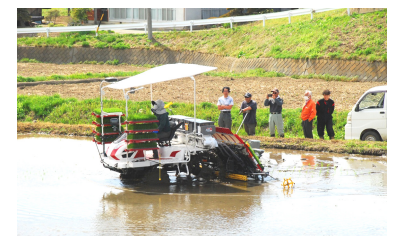
関係者に見守られ軽快に動く田植え機

毎年4月20日前後が中坪ノーサンのルーティン、田植え開始の日です。稲苗は順調に育ち、田植え機も新調。田植え初めはいつもの棚沢橋近くの田んぼから。20日午後に報道各社やJAの関係者らが見守る中で田植えスタート。新車であるため、条件を入力しながらの作業でした