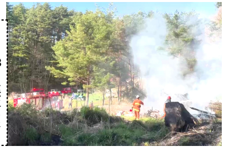
4月18日に発生した 鐘付の火災

区長選出や、総会開催など、今の中坪規約の中で矛盾が生じている点が多々あります。そこで、常会毎に規約検討委員会を選出していただき、委員会で原案を立て、区会で審議し、臨時総会を開催して新しい規約を決定していきたいと考えています。 区民の皆さまには、ご理解とご協力をよろしくお願ひします。 別件になりますが、3月と