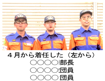
4月から着任した(左から) ○○○部長 ○○○団員 ○○○団員

本年度より手良分団第1部の部長に任命されました郷之坪の○○○(屋号・○○○)です。区民の皆さまには日頃より消防団活動へ