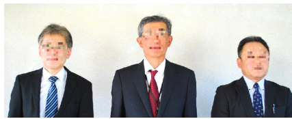
総務区長 ○○○○ 区長 ○○○○ 会計区長 ○○○○

報「なかつぽ」をご覧ください。自然豊かで住みよいふるさと中坪を守り続ける為に、コンパクトな区政を目指していきたいと思ひます。