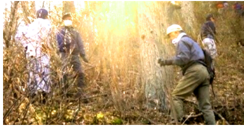
境界杭を探しながら山に登る出席者

去る3月15日(日)、午前8時から、竜の沢区有林の境界杭(くい)確認作業を行いました。作業には、林務委員、区長、元林務委員長の計14名の出席をいただき、行いました。竜の沢区有林は、大平と徳切洞の2班に分かれ、それぞれ5名と9名で作業を行いました。