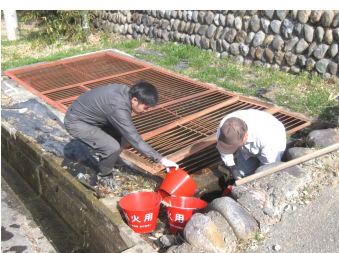
泥溜め清掃をする会員

本作業をもって、今年度の主な事業はすべて終了となります。これまでの区民の皆さまのご協力に、心より感謝申し上げます。(令和7年度総務区長)