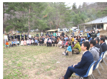
園庭での入園式総勢100名が集結

3月20日(金)春分の日に、山の遊び舎はらぺこの21回目の卒園式がありました。今年度は5人の年長児が卒園していきましました。入場では歌に合わせて、年長児一人ひとりの名前を呼んで迎え入れ、卒園式がはじまりました。卒園児一人ひとりに向けたメッセージが書かれた証書を受け取り、「さよならぼくたちのはらぺこ」(替え歌)を歌い、たくさんのお保護者、OBの方々に見守られたあたたかい式となりました。