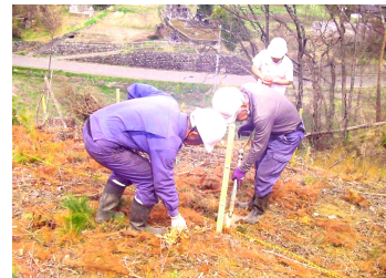
植樹する千本桜の会の皆さん

4月5日(日)に今年度の「植樹」(最後の植樹)を行いました。令和4年から始めて5年かかり、伐採した山全ての斜面に植樹することができました。植樹の内訳を整理すると、ヨシノ桜・八重桜・しだれ桜が850本、山桜830